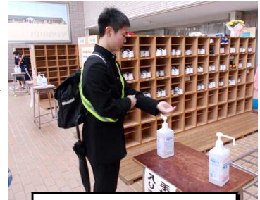
生徒会長も手指消毒...