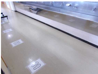
手洗い場も前後左右の間隔を...

生徒の下校後は、職員が分担して使用場所のドアノブ等を消毒し、翌日の登校に備えています。毎日大変ですが、生徒の皆さんの安心・安全確保のため、頑張っています。