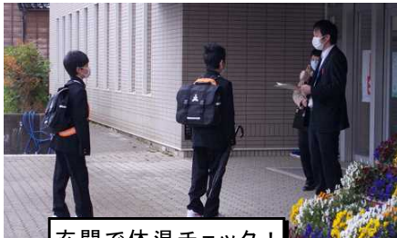
玄関で体温チェック! 忘れた生徒は検温...

半日程度の登校日ですが、宿題点検や教育相談を行うなど、一人一人の心のケアに努めています。また、2～3時間程度、昨年度の未履修の教科を中心に授業も進めています。