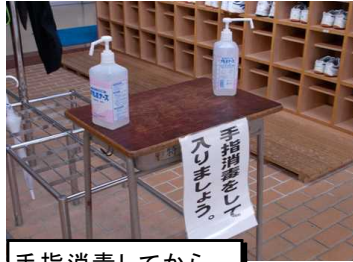
手指消毒してから 内履きに替えます!