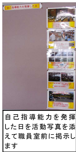
自己指導能力を発揮した日を活動写真を添えて職員室前に掲示します