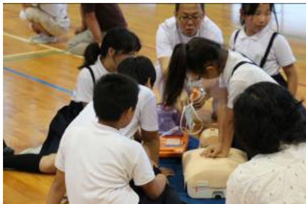
【5・6年生は、体育館でグループによるAEDの実習】

その後、七尾東部中の刀裨栄養士による「食事が大切！生活習慣病予防～ずうっと健康に過ごすために～」がありました。今回の講話は、保護者だけではなく5・6年生も一緒に話を聞き、今後の食生活に生かされる様子でした。