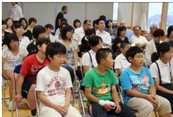
【保護者と一緒に講話を聴く5・6年生】