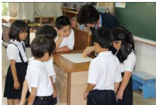
【先生と一緒に考える1年の算数】

1年生は、算数の「いろいろなかたち」で図形の勉強を学び、2・3年生は、学活で、食べ物の「すききらい」を学年に関係なく一緒に学びました。4年生は、国語で「読書生活を考えよう」、5・6年生は、「AEDを使ってみよう」ということで、能登病院から指導者を招き、親子で実習しました。