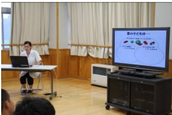
【講話中の七尾東部中の刀裨栄養士】

尚、授業参観(参加)の前には、例年恒例の給食試食会を1年生の保護者とPTA役員で行いました。